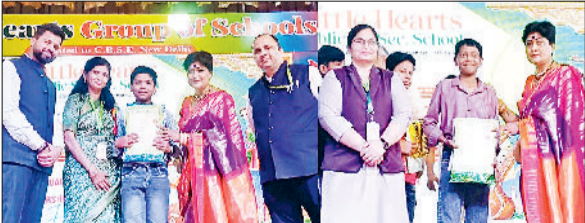
भिवानी। मेधावी विद्यार्थियों को पुरस्कृत करते अतिथि।