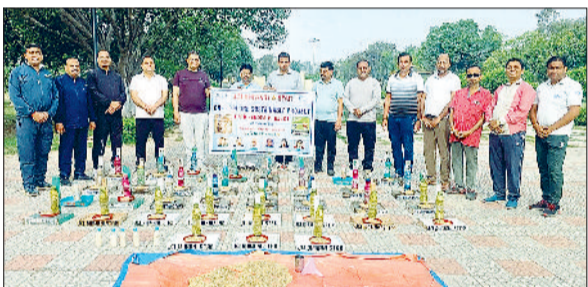
भिवानी। पक्षियों के लिए दान-पानी की व्यवस्था करते जेसीआई के सदस्य।

जेसीआई भिवानी स्टार ने पर्यावरण संरक्षण एवं जीव सेवा की दिशा में सराहनीय कदम उठाया है। संस्था ने वन लोम, वन सस्टेनेबल प्रोजेक्ट के अंतर्गत शहर में बर्ड फीडर प्रोजेक्ट की शुरुआत की है। अभियान का मुख्य उद्देश्य शहरी क्षेत्रों में पक्षियों के लिए दाने-पानी की उचित व्यवस्था करना है, ताकि बढ़ती गर्मी और कंक्रीट के जंगलों के बीच इन बेजुबान पक्षियों का संरक्षण सुनिश्चित किया जा सके। अभियान को सुचारू रूप से चलाने