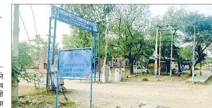
बाढ़ड़ा। बिजली निगम का कार्यालय।

दक्षिणी हरियाणा बिजली वितरण निगम ने ग्रामीण क्षेत्र में बढ़ रही बिजली चोरी व अपने लंबे समय से अधर में लटके बिलों की राशी के बकायादारों से वसूली प्रक्रिया तेज कर दी है। बाढ़ड़ा सब डिवीजन क्षेत्र में 6 करोड़ से अधिक की बकाया थी जो मामूली ही रिकवरी हो पाई और अभी भी करोड़ों रुपया बकाया है। बिजली निगम ने पिछले चार दिन में लगातार अभियान चलाकर 40 से अधिक चोरी की घटनाएं पकड़ी हैं जिनपर भारी जुर्माना लगाया है। प्रदेश के दक्षिणी हरियाणा के कई जिलों में लंबित बिल अदा न करने