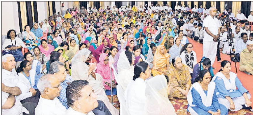
भिवानी। आयोजित सत्संग में उपस्थित श्रद्धालु।