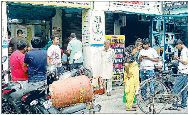
भिवानी। गैस एजेंसी पर सिलेंडर लेने के लिए लगी उपभोक्ताओं की भीड़।

घरेलू और कमर्शियल सिलेंडर की किल्लत के चलते लोगों की परेशानी कम होने का नाम नहीं ले रही, बल्कि बढ़ती ही जा रही है। गैस किल्लत के चलते बेटे-बेटी के जन्म पर जलवा पार्टी व मृत्युभोज काज प्रसाद आदि कार्यक्रम करने के लिए बहुत विकट समस्या बनी हुई है। गैस डिलीवरी के 25 दिन बाद गैस बुकिंग की समस्या और इसके सप्ताह तक गैस सिलेंडर घर पर डिलीवर होने की समस्या से आमजन बुरी तरह से त्रस्त है। वहीं गैस किल्लत के चलते होटल व ढाबों पर रेटों में अचानक से बढ़ोतरी हो गई है, जो आमजन की जेब पर डाका है। अमेरिका-इजराइल व ईरान के बीच युद्ध के चलते प्रदेश में तेल व गैस की किल्लत बनी हुई है। गैस किल्लत के चलते बच्चों के जन्म पर जलवा पार्टी व मृत्युभोज काज प्रसाद कार्यक्रम करवाने के लिए विकट समस्या बनी हुई है। गैस डिलीवरी होने के 25 दिन बाद गैस बुकिंग हो सकती है और इसके एक सप्ताह बाद तक गैस सिलेंडर घर पर डिलीवर होगा, जो आमजन को परेशानी में डाल रहा है। वहीं गैस किल्लत के चलते होटल व ढाबों पर