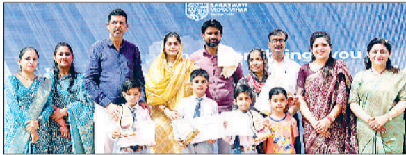
भिवानी। वार्षिक परीक्षा परिणाम अवसर पर बच्चों को सम्मानित करते हुए।

सरस्वती विद्या विहार, आसलवास दुबिया में वार्षिक परीक्षा परिणाम दिवस बड़े ही उत्साह, उल्लास और गरिमाय वातावरण के बीच मनाया गया। कक्षा नर्सरी से 9वीं तथा कक्षा 11वीं तक के विद्यार्थियों का परीक्षा परिणाम घोषित किया गया। कार्यक्रम के दौरान विद्यालय प्रबंधन द्वारा मेधावी विद्यार्थियों को प्रोत्साहित करने के लिए आकर्षक छात्रवृत्तियों की घोषणा की गई। कक्षा नर्सरी से पांचवी कक्षा तक के विद्यार्थियों में प्रथम स्थान प्राप्त करने वाले विद्यार्थियों को 10,000, द्वितीय स्थान प्राप्त करने वाले विद्यार्थियों को 7,500 तथा तृतीय स्थान प्राप्त करने वाले विद्यार्थियों को 5,000 की