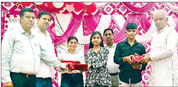
भिवानी। मेधावीयों को पुरस्कार देकर सम्मानित करते हुए।